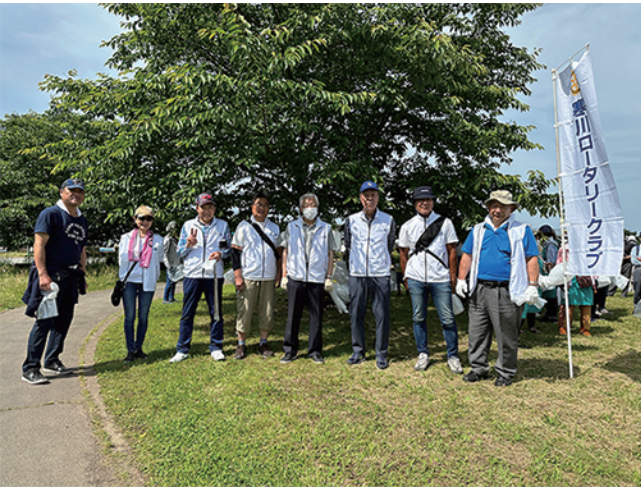
6月4日(日) ボーイスカウト寒川第2団 発団50周年記念式典出席